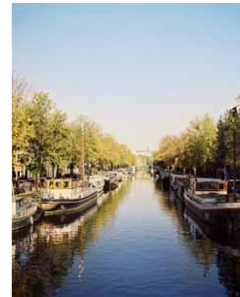
GRACHTEN Kan het sfeervoller? Shoppen tussen de mooie Prinsen- en Brouwersgracht,