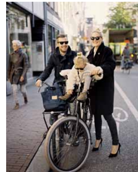
EN FAMILLE Jong en oud vergaapt zich aan de winkels en het kleurrijke publiek.

PRODUCTIE Hugo Kusters ☞ FOTOGRAFIE Brenda van Leeuwen ☞ TEKST Erik Paul Jager ☞ ILLUSTRATIE Olaf Hajek