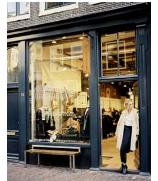
DENIM De beste jeansmerken zijn hier te vinden, en andere toplabels in vrijetijdskleding.