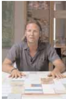
Bijschrift Henk Bij schrift Henk Bijschrift Henk